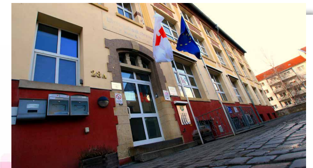
Schulhaus Kochstraße 28a, Südvorstadt

Als Schule in freier Trägerschaft ist die Freie Fachoberschule Leipzig verpflichtet, ein monatliches Schulgeld zu erheben. Gemäß § 10, Abs. 1, Ziffer 9 Einkommensteuergesetz können Eltern einen Teil des Schulgeldes in der Einkommensteuererklärung als Sonderausgaben geltend machen.